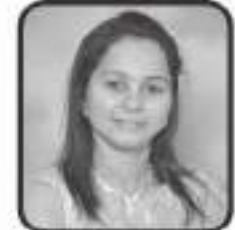
સંસારી ફોરમી નવીન

અમારા આમંત્રણનો સ્વીકાર કરી માં ના મેળે વેળાસર પધારવા નમ્ર વિનંતી...!!!