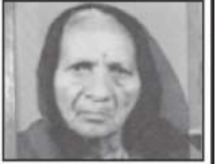
પૂજ્ય ભાવલ માં